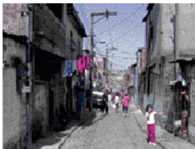
Ensemble n°208 - janvier 2006

La richesse d'une société peut se mesurer à l'ampleur de ses déchets. À Sao Paulo, il n'y a pas de collecte publique. Ce sont les "ramasseurs" munis de charrettes, qu'ils bâchent pour y dormir la nuit, qui arpentent la cité en recueillant les sacs poubelles. Ils les conduisent dans des coopératives dont les employés effectuent le tri des déchets. Ainsi le premier jour de notre voyage d'étude, responsables et ramasseurs de la COORPEL nous présentent