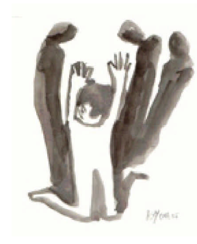
Job, 2005 encre sur papier, 25×25