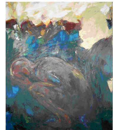
Sur les rives, 2004 Huile sur toile 46×52