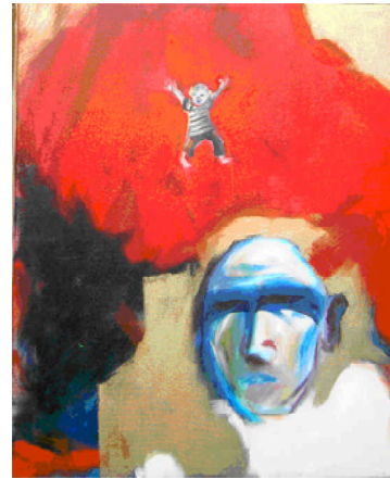
Abraham et Isaac, 2003 Huile sur toile, 38 × 46

Envol - Euro Student Café /FEC, Strasbourg