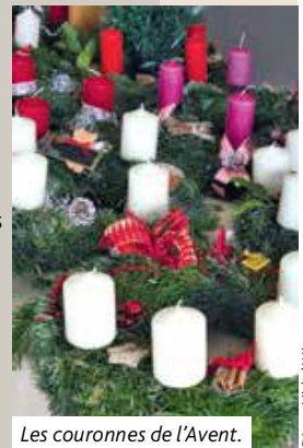
Les couronnes de l'Avent.

• Les 4 es mercredi à 20h Rencontre des Femmes européennes pour la confection des couronnes de l'Avent le 25 novembre au foyer Mélanie. Nous fournissons les branches de sapin, vous apportez vos bougies et décorations, et si vous les avez gardés, les fonds de couronne. Participation aux frais : 6€. Inscription : tresorerie.bm@gmail.com