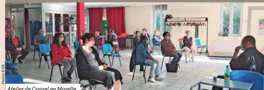
Atelier de Gospel en Moselle.