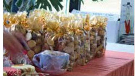
Ambiance de Noël

Pour pouvoir réaliser les tombolas – chaque ticket est gagnant- nous comptons sur les lots que vous voudrez bien nous donner.