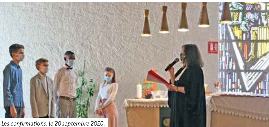
Les confirmations, le 20 septembre 2020.

Les prochaines rencontres, toujours le samedi de 18h à 21h, auront lieu aux dates suivantes : 7 et 21 novembre à la Robertsau, 5 décembre à Saint-Matthieu.