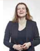
La soprano Ninon Demange .