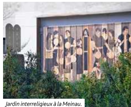
Jardin interreligieux à la Meinau.

Samedi 1 er avril à 18h : Sortie au Jardin interreligieux de la Meinau avec des jeunes de la paroisse catholique.