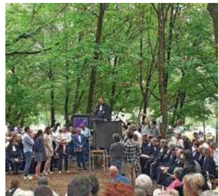
Le culte de l'Assemblée du Désert du 4 septembre 2022.