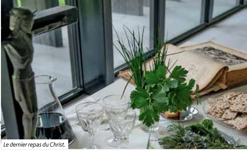
Le dernier repas du Christ.